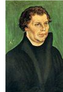
Maarten Luther (DE)