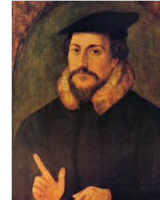
Johannes Calvijn (Fr)