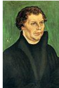
Maarten Luther (DE)