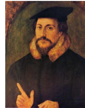
Johannes Calvijn (Fr)